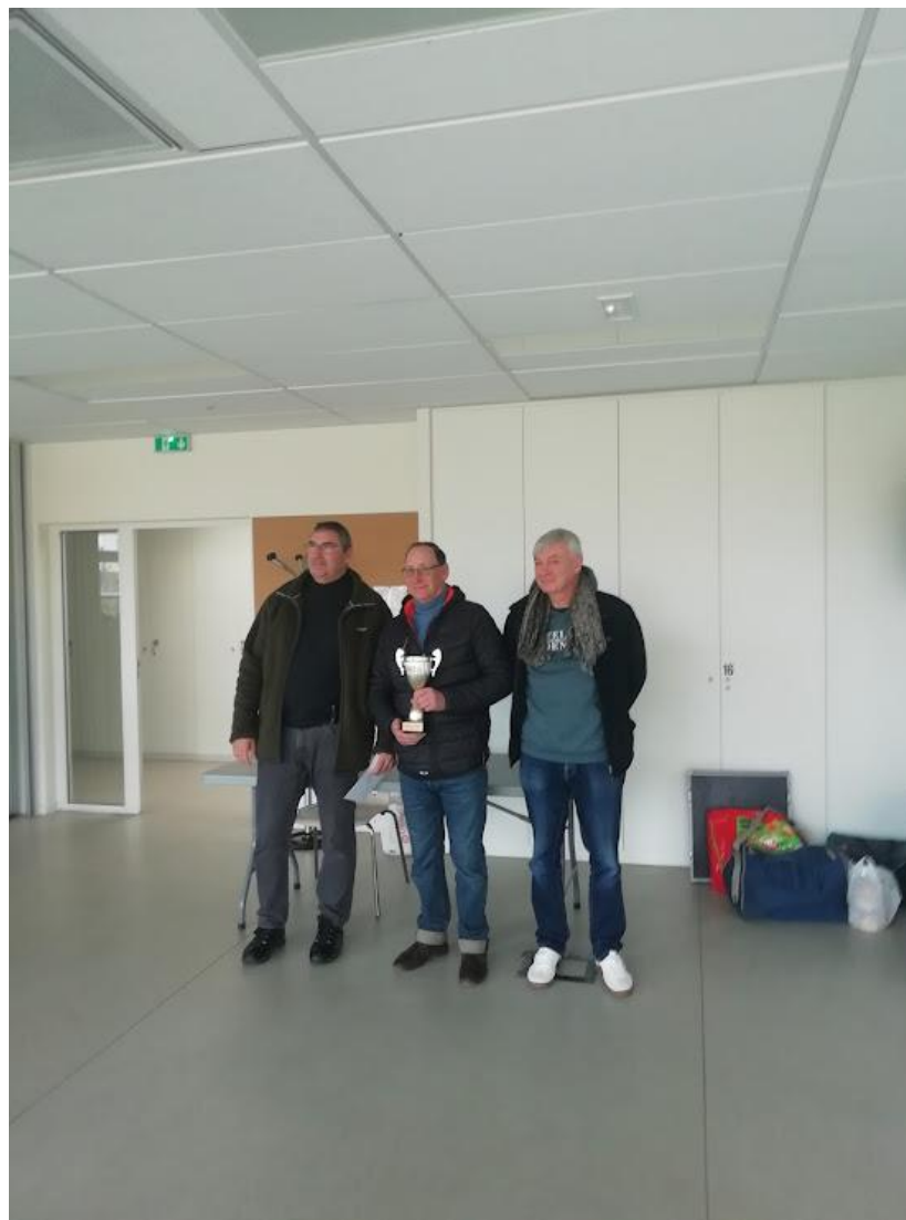
1 2 et 3 ème du MASTER DE YVELINES 2023