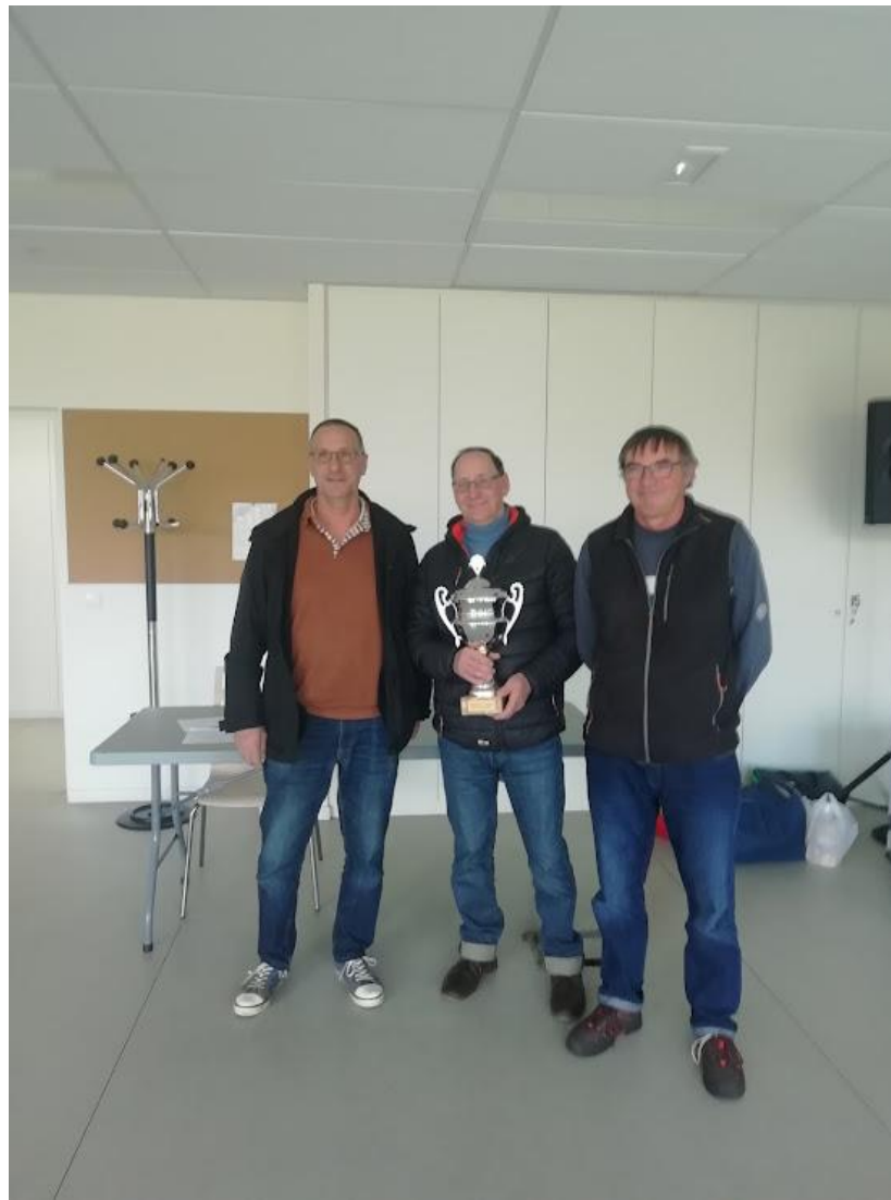
1 er 2 e et 3 e me du CRITÉRIUM DU CD78